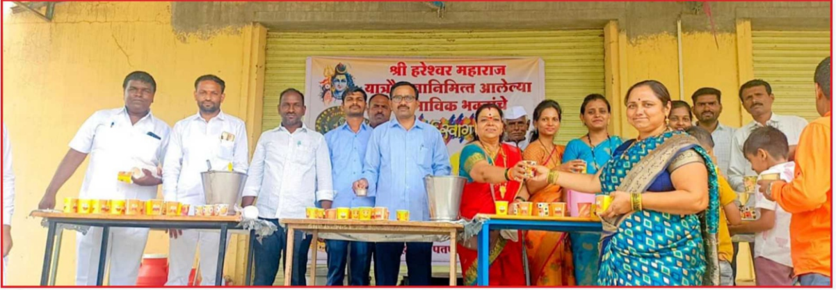
श्री हरेश्वर देवस्थान यात्रेनिमित्त भाविक भक्तांसाठी संस्थेतर्फे फळांचे ज्यूस वाटप प्रसंगी संस्थेचे संचालक व कर्मचारी वृंद.