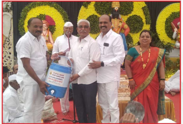
श्री हरेश्वर देवस्थान ट्रस्ट यांना संस्थेतर्फे पाण्याचे जार भेट देताना संस्थेचे संचालक मंडळ.